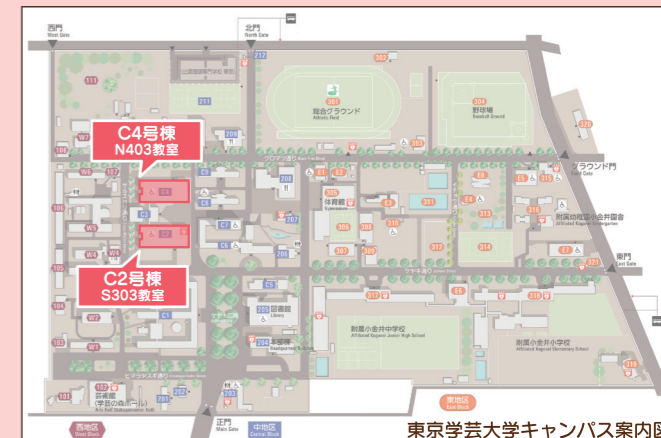
東京学芸大学キャンパス案内図